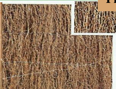
Brande naturelle (Bruyères sélectionnées)