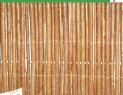
Osiers Naturels Entiers